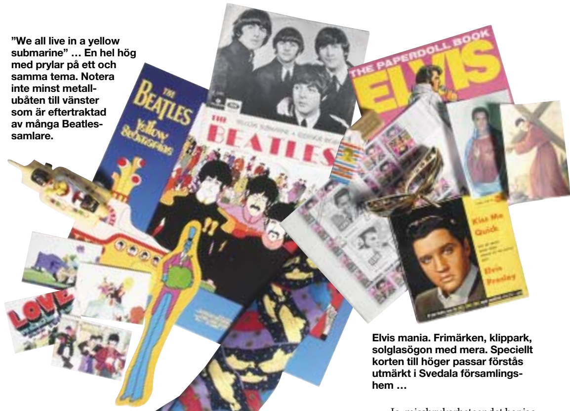
Elvis mania. Frimärken, klippark, solglasögon med mera. Speciellt korten till höger passar förstås utmärkt i Svedala församlingshem ...

”We all live in a yellow submarine” ... En hel hög med prylar på ett och samma tema. Notera inte minst metallubåten till vänster som är eftertraktad av många Beatles-samlare.